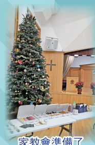
家教會準備了西式早點與校長、家長分享