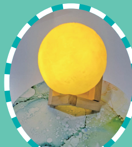
心靈藝術工作坊水晶球作品

回家後，我把水晶球送給兒子，他還擺放它在自己的玻璃儲物櫃裏好好展示出來。我認為心靈藝術活動對任何人來說都是一種身心健康的體驗，希望日後能再參加同類活動。