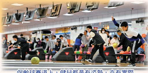
保齡球賽道上，健兒都是有姿勢，亦有實際