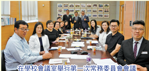
在學校會議室舉行第一次常務委員會會議

周年會員大會結束後，新一屆委員隨即舉行第三十一屆家長教師會第一次常務委員會會議，為新學年訂定全年工作計劃。