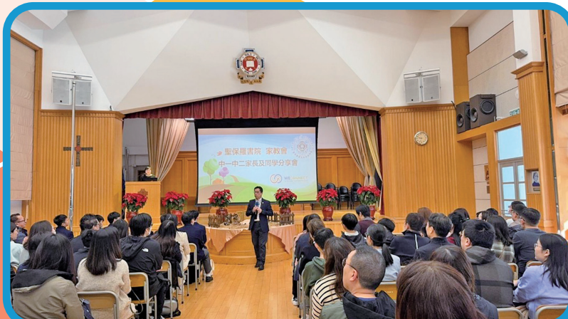
校長與中一、中三家長分享育兒經