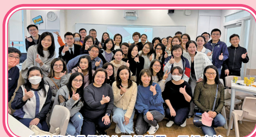
活動讓家長們藉此互相學習、互相支持，在培育孩子的路上加增力量