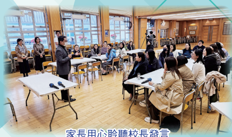
家長用心聆聽校長發言