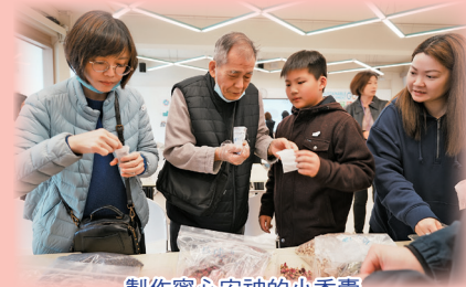
製作寧心安神的小香囊