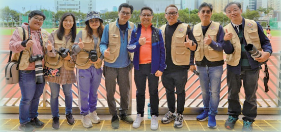
家長教師會攝影隊施展攝影專長，透過鏡頭捕捉活動的珍貴時刻（攝於學校運動會決賽日）

這些努力也獲得了校長的高度肯定，攝影隊多次收穫校長的表揚。校長在不同場合提及，攝影隊用專業且充滿溫情的鏡頭，將校園活動中的精彩與感動定格，不僅為師生留下了珍貴的回憶，也讓我們家長們能透過照片，更深入地了解校園生活。這些表揚不僅是對攝影隊工作的認可，更是激勵大家繼續前行的動力。