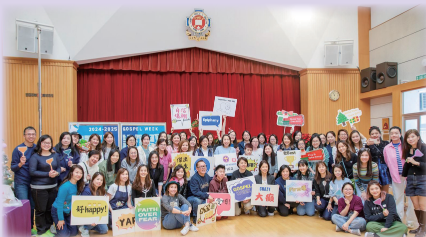
The Glorious Feast was successfully held, featuring an array of vibrant props.

As a rough estimate, more than one thousand students participated in the Feast throughout the day. Even though time flies when you are having fun, the magical moments filled with love, joy, and happiness continue to linger in their memories. The Feast was a great success and one of the most brilliant celebration activities during Gospel Week. We look forward to seeing all the students again next year.