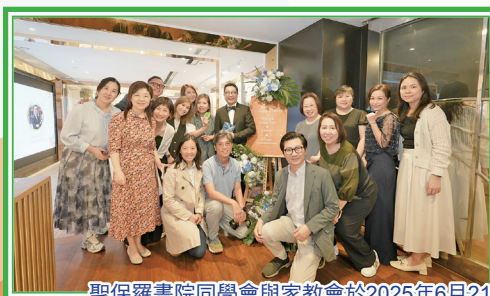
聖保羅書院同學會與家教會於2025年6月21日假尖沙咀帝國中心Club One舉行校長榮休晚宴， 筵開三十二席，以感謝源校長三十二年來對聖保羅書院作出的卓越貢獻。