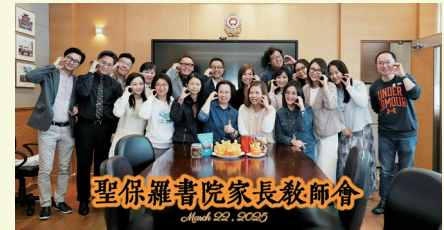
聖保羅書院家長教師會 March 2025