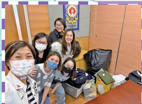
家教會成員與家長義工一同合作完成校服回收工作