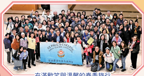
充滿歡笑與溫馨的春季旅行

這次春季旅行，充分展現了家教會的細心安排和對家長、學生的關心。大家都表示希望未來能有更多同類型的活動，共享家庭時光，締造更多美好的回憶。