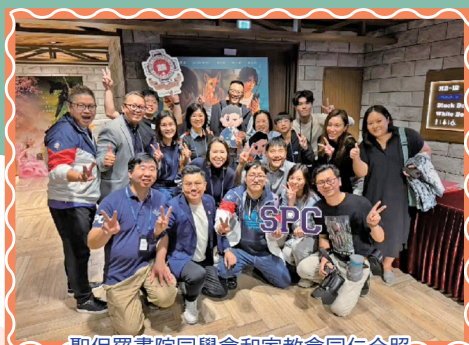
聖保羅書院同學會和家教會同仁合照