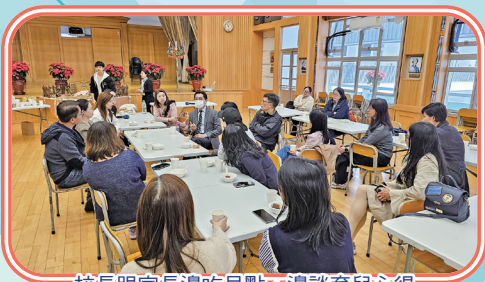
校長跟家長邊吃早點，邊談育兒心得

這次早餐會，成功拉近了家長和學校的距離，不僅讓彼此得以直接交流，還為家長提供了一個互相支持的平台。我們期待未來舉辦更多類似的活動，讓家長與學校攜手同行，共同見證孩子的成長，培育更多具有紳士風範的「保羅仔」。