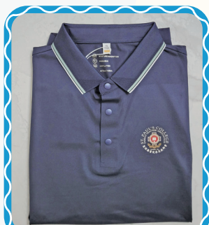
聖保羅書院家教會與英皇書院家教會 於2025年7月5日舉行聯校活動， 製作了紀念馬球襪衫