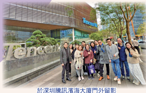
於深圳騰訊濱海大廈門外留影