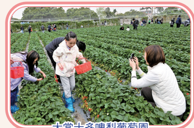
大棠士多啤梨葡萄園