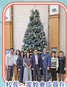
校長、家教會成員在聖誕樹下拍照留念