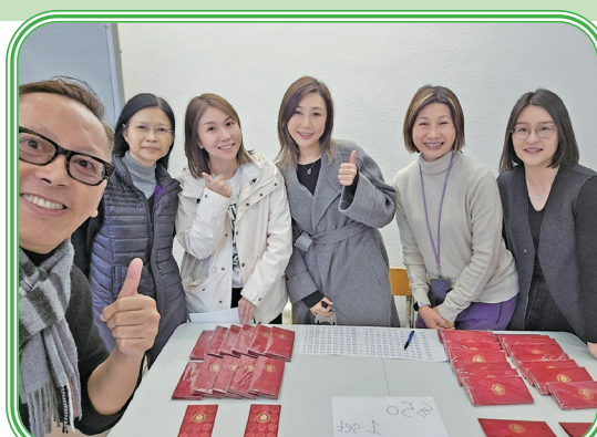
家教會委員落力售賣設計精美的利是封