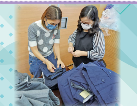
家教會成員逐一檢查回收來的校服才轉贈給家長