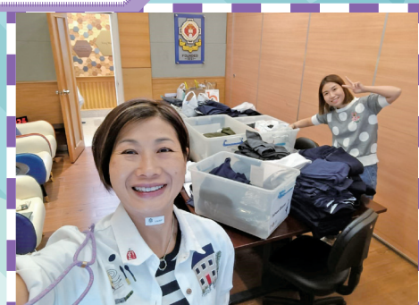
校服回收任務完成！