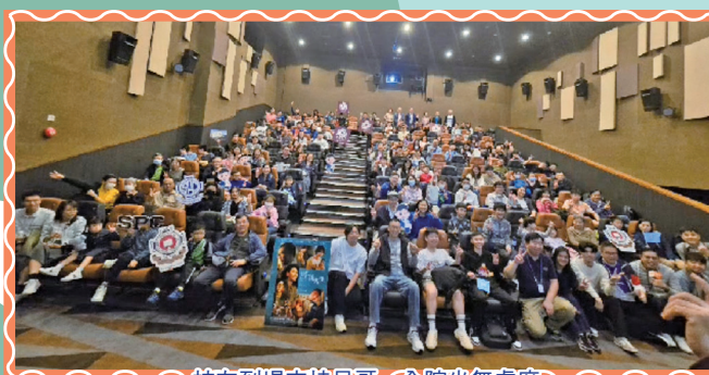
校友到場支持旦哥，全院坐無虛席