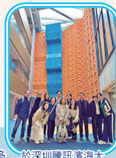
於深圳騰訊濱海大廈內的攀岩牆留影