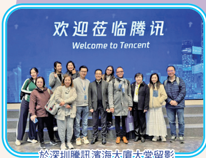
於深圳騰訊濱海大廈大堂留影