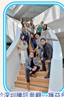
於深圳騰訊參觀，獲益良多