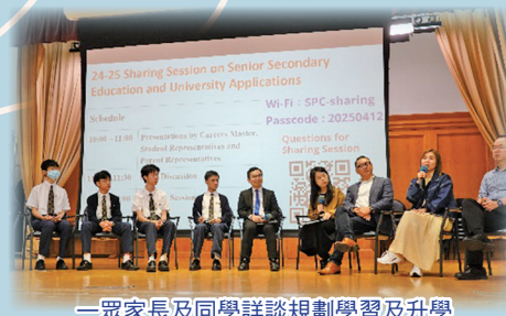
一眾家長及同學詳談規劃學習及升學